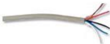
Κοινό τηλεφωνικό καλώδιο